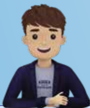
Antoine, votre assistant virtuel 24h/24

Pensée pour être plus épurée, intuitive et plus performante, elle s'accompagne également d'un assistant virtuel, Antoine, qui répondra à toutes vos questions.